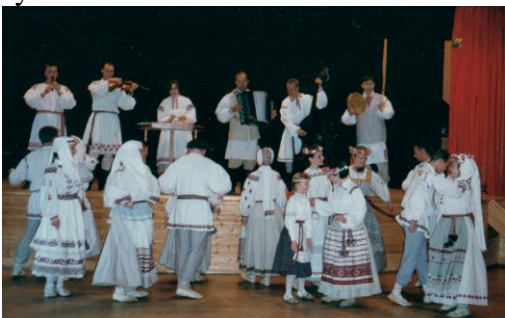
Danse- og folkemusikkgruppa Nerush fra Hviterussland har gjestet Ringebu flere ganger med rotaryklubben som vertskap.

Klubbens medlemmer har vært vertskap for danse- og folkemusikkgruppa Nerush fra Universitetet i Minsk i Hviterussland. Sammen med m.a. Pensjonistlaget har Rotary-klubben arrangert konserter med stort frammøte, og velkomne penger til reisekassa deres. I forbindelse med at Nerush feira sitt 25-årsjubileum var deres verter i Norge invitert til Minsk for å delta i feiringa. Det var en stor fest med deltakelse av statsråd og byledelse.