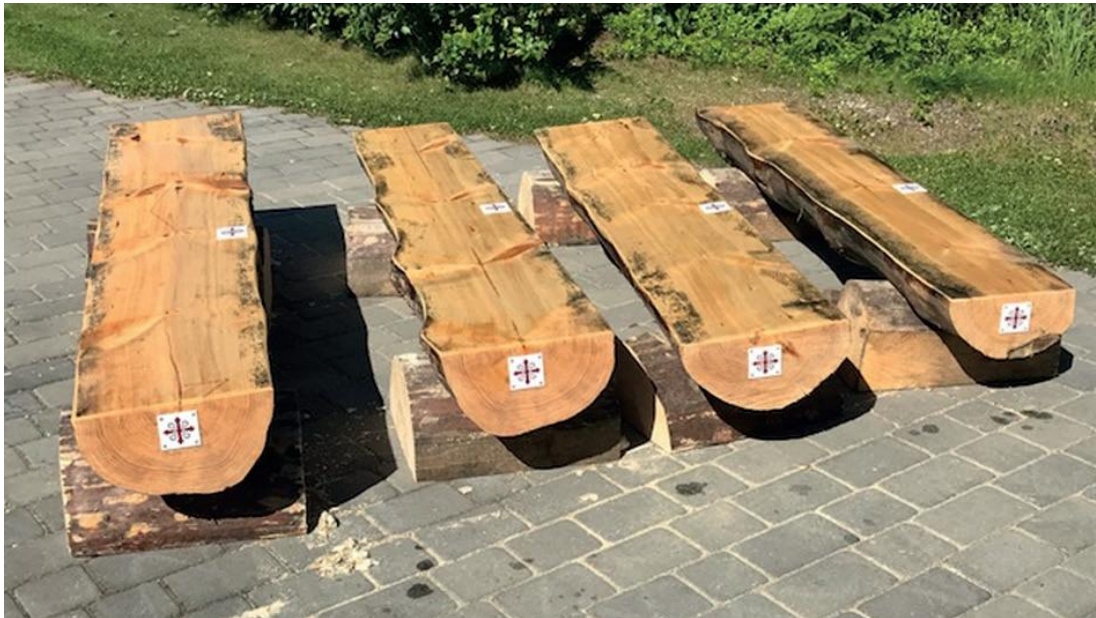
«Tenketankebenkkene» som er plassert langs Pilgrimsvegen gjennom bygda.