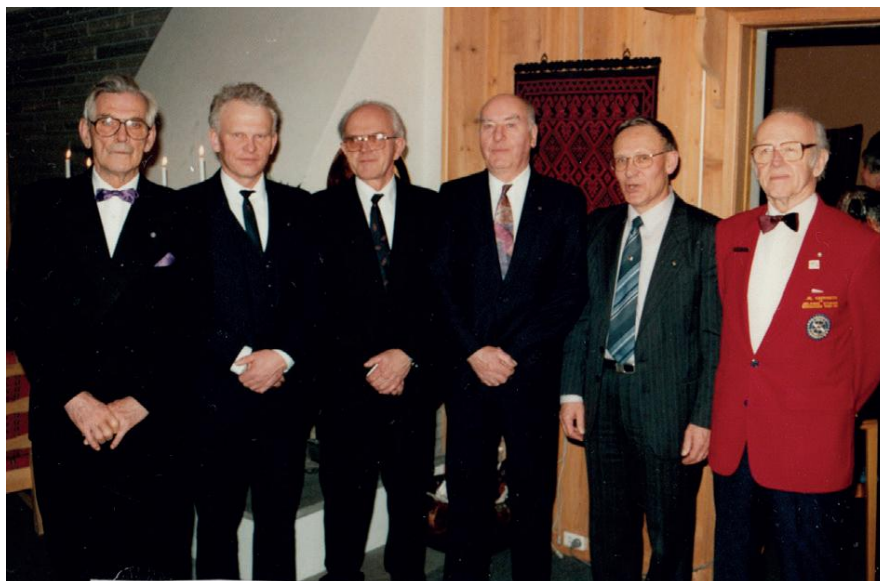
Styret sammen med distriktsguvernøren ved 25-års jubileet i 1992.

18.30 på Bjørge Hotell. I 1968 vedtok klubben at møtene skulle holdes på tirsdager. Det blir de fortsatt.