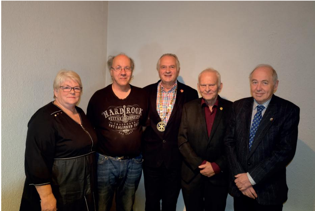
Styret i jubileumsåret.

Klubbvimpler blir utvekslet på besøk i klubber over hele verden. Ringeby RK fikk tidlig sin vimpel, som ble fornya med motiv fra stavkirka i 2007.