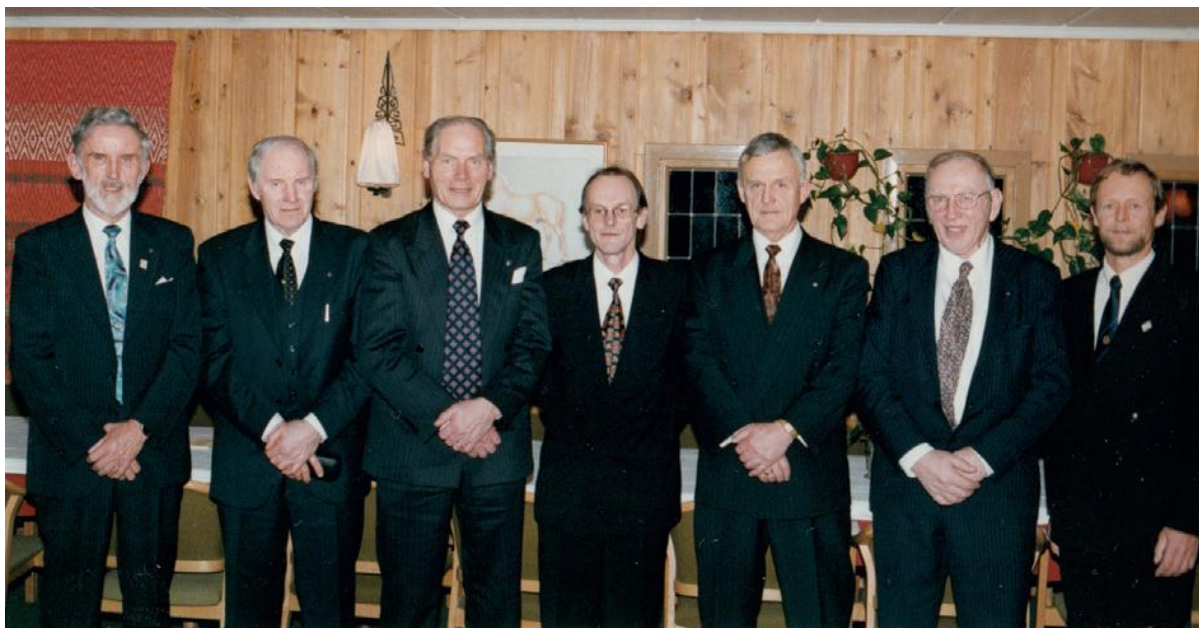
Fra klubbens 30-års jubileum.

Foredragene , både av interne og eksterne foredragsholdere har gjennom årene favnet over et vidt spekter. Hovedvekten har vært rettet mot lokale forhold, gjerne også med utflukter til institusjoner og bedrifter i lokalmiljøet. Egoforedrag har alltid vært interessante og viktige for forståelsen mellom medlemmene.